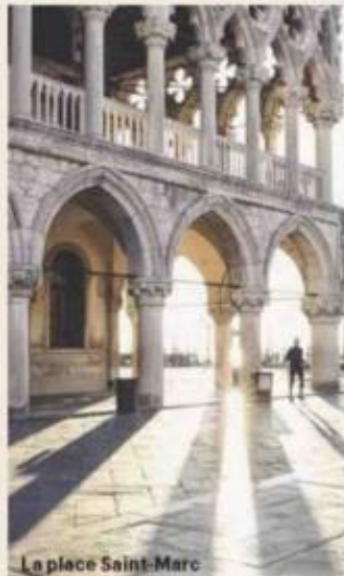
La place Saint-Marc