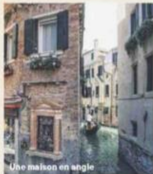
Une maison en angle

Chaque semaine, la créatrice de Pathport Laurence Delebois rencontre le guide local idéal. Episode 7: Venise vue par Jacopo de Michelis .